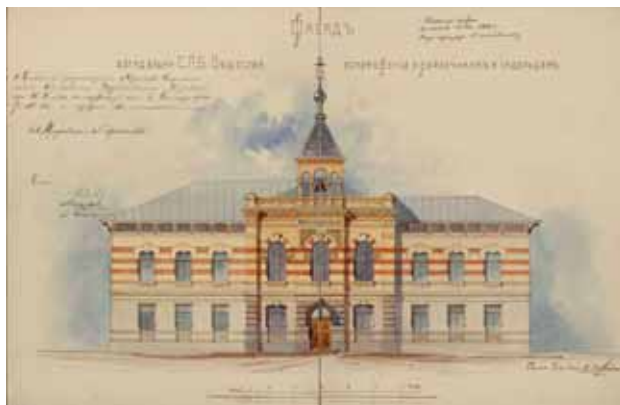
Богадельня Санкт-Петербургского общества вспоможения приказчикам и сидельцам, 1902 г.

Район Пискаревки, застроенный в основном в 1960–1970-х годах, не особенно богат на архитектурные достопримечательности. Тем не менее, они здесь есть. Одна из них – здание на углу Кондратьевского проспекта и Бестужевской улицы, в котором располагается 21-й отдел полиции Калининского района.