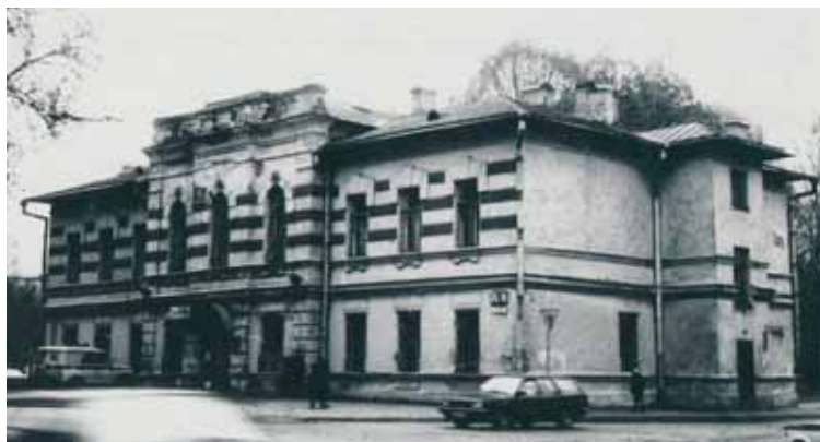
1995 г.