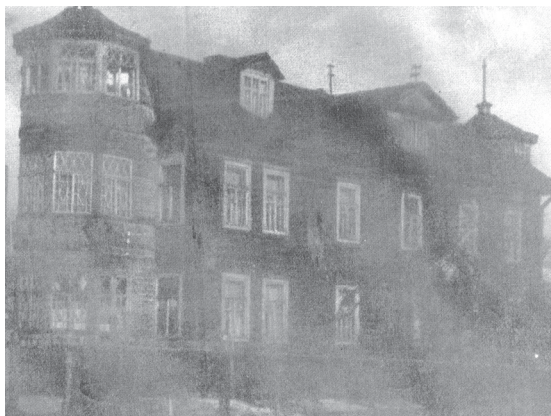
Улица Полевая Сабиловская, дом 34

Вскоре началась война, и отчима забрали на фронт. В апреле–мае 1942-го его убили, а 17 марта 1942 года у мамы родился второй ребенок. «Тащи мулине», – кричала она. Я не растерялась и принесла нитки. Дальше я – двенадцатилетний подросток, помогала принимать роды.