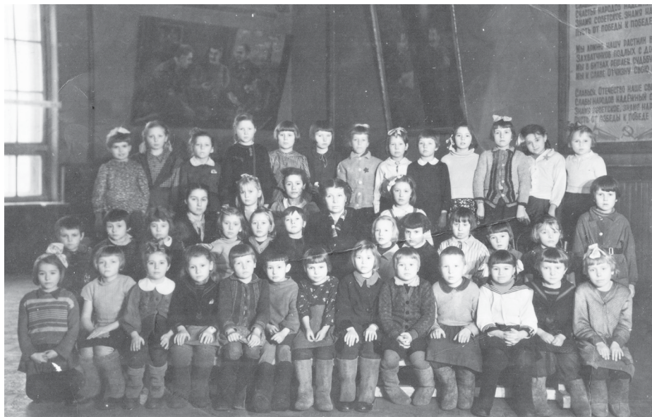
67-я женская школа Петроградского района. 1945–1946 уч.год